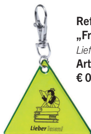
Reflektor-Anhänger „Fridolin“ Liefereinheit: 1 St. Artnr. 30-381871 € 0,80