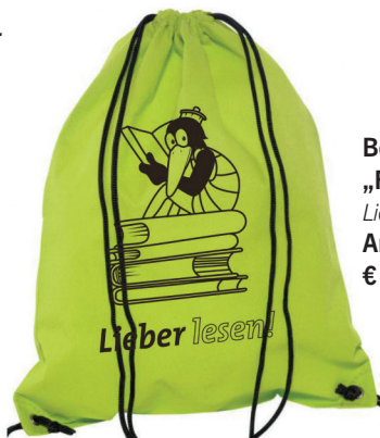
Beutel mit Kordelzug „Fridolin“ Liefereinheit: 1 St. Artnr. 30-381875 € 2,20